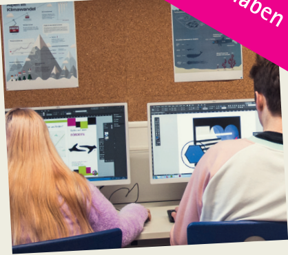
Gestaltung des vorliegenden Flyers: Projekt der Klasse 13 des Beruflichen Gymnasiums