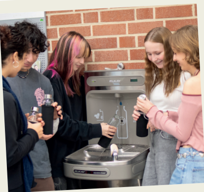
Die Installation eines Wasserspenders mit Filtersystem