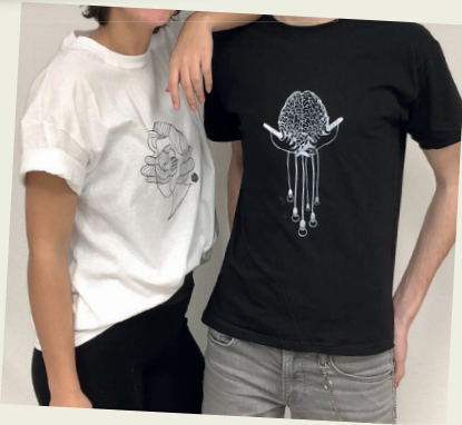
Abi-T-Shirt, Entwurf von David Felzen